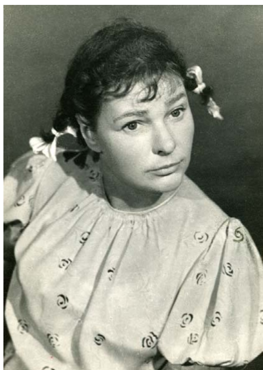
В роли Выриковой в спектакле «Молодая гвардия» по роману А. Фадеева