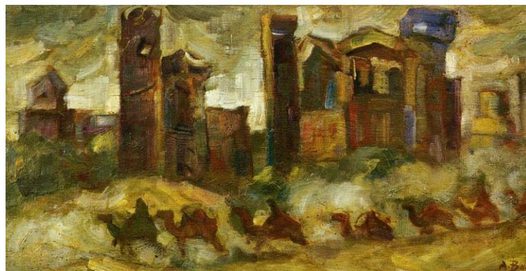
А. Волков. «Караван» Фанера, масло. 1944

Улочка, идущая дальше на запад от Шейхантаура, вглубь старого города... приводила к исконному центру Ташкента — Хадрэ. Этот центр возник ещё в VII веке и сохранял своё значение благодаря главному рынку города — Старогородскому базару.