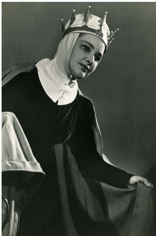
В роли Королевы и Актёра в спектакле «Гамлет» по пьесе В. Шекспира