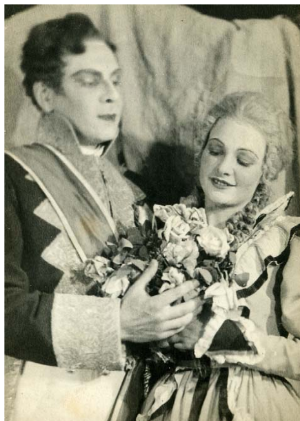
В роли Эмили в спектакле «Эмилия Галотти» по пьесе Г.-Э. Лессинга