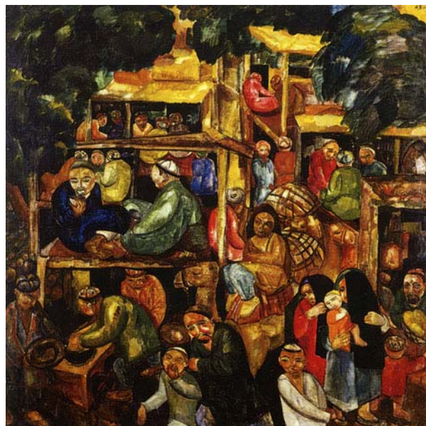
А. Волков. «Чайханы старого города» Холст, масло, темпера, лак. 1926

к сожалению, курили анашу, характерный запах которой доносился из темноватого помещения чайханы. Почему-то мы с Ириной решили проводить агитацию против употребления наркотиков. До сих пор не пойму, почему нас не побили одурманенные наркоманы. Было нам в те годы всего двенадцать и четырнадцать лет, и мы самоуверенно, если не сказать нахально, поучали взрослых мужчин, что курить анашу вредно. Идиллические были времена!