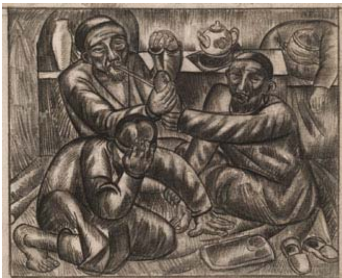
А. Волков. «Курильщики анаши» Бумага, чёрный карандаш. 1926