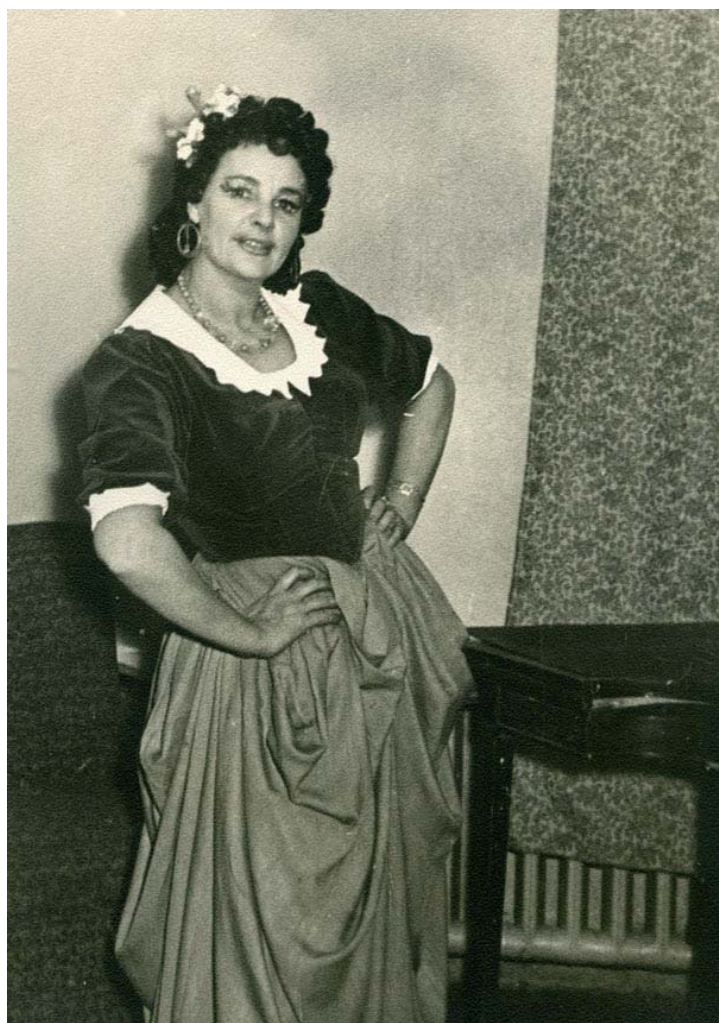
В роли Марселлы в спектакле «Собака на сене» по пьесе Л. де Веги (1956 г.)