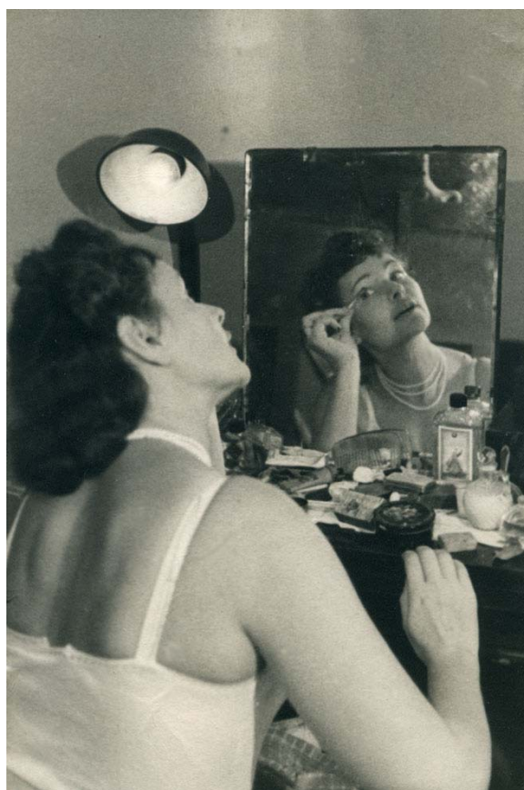
В гримёрной (на гастролях)