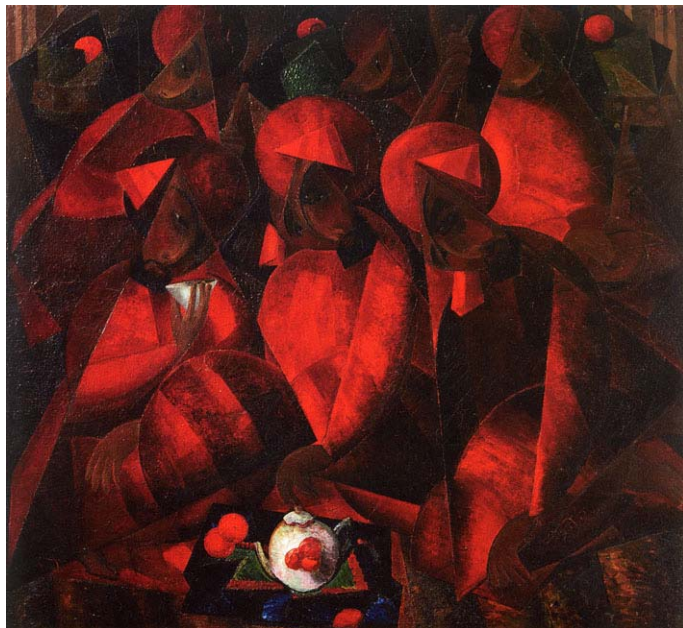
А. Волков «Гранатовая чайхана» Холст, масло. 1924

В старый город трамвай ходил по улице Ленина, через Обуховский сквер, и мы, дети, ездили на нём «покататься». ...По пути [к базару] была остановка «Шейхантаур», священное для мусульман место. Хорошо помню посещение Шейхантаура во время поста — уразы. Лишь вечером, когда по правилам уразы «белую нитку нельзя отличить от чёрной», не только утоляется голод, но начинается настоящий праздник. ...Трубили гигантские карнаи, рассыпались дробью большие бубны-дойры и барабаны-ногора — керамические горшки с натянутой на горловину кожей. Узбечки появлялись на празднике только в парандже, накинутой на голову, с лицом, закрытым чачваном — чёрной сеткой из конского волоса. Нам с сестрой одна знакомая подарила такие паранджи с чачванами и дойру. Играя, мы надевали этот наряд и выходили в нём на улицу. Под дойру, на которой научились играть, пели узбекские песни и танцевали. В те времена в моде была песня «Аманвёр».